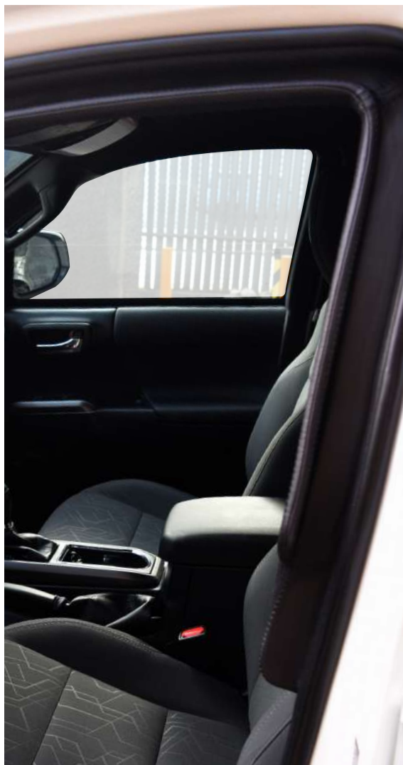
*Bisel en forma de "L" en Nivel IV Plus