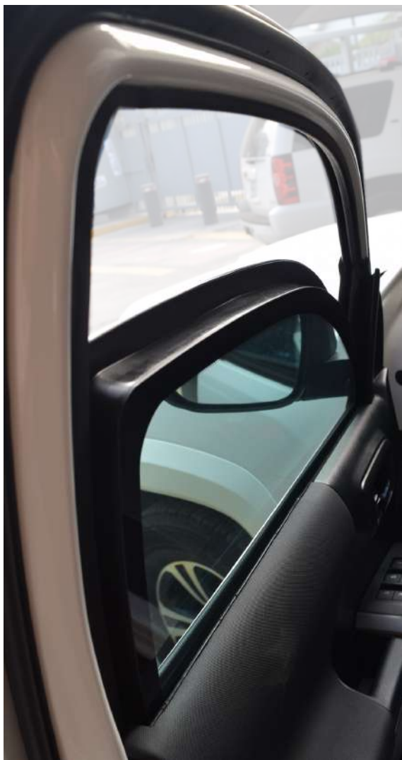
*Blindaje en cristales Nivel IV Plus