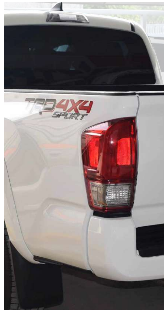
*Blindaje en cristales traseros Nivel IV Plus